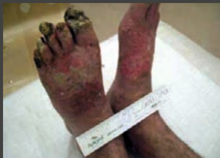
BEMER TERÁPIA ELŐTT