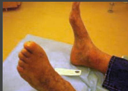
TARTÓS BEMER TERÁPIA UTÁN